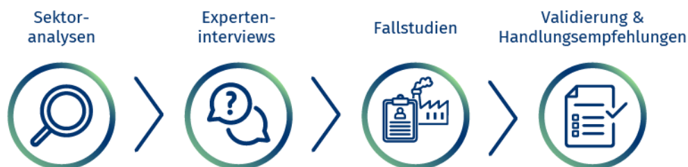
Abbildung 2: Methodisches Vorgehen bei H2PRO

Das gesamte Forschungsdesign umfasst die drei Hauptschritte Sektoranalyse, leitfadengestützte Experteninterviews und arbeitsprozessorientierte Betriebsfallstudien. Eine Rückkopplung von Annahmen, Bestandsaufnahmen, Ergebnissen Handlungsempfehlungen mit Berufsbildungspraxis und Berufsbildungspolitik sollen zwei Fachtagungen, Validierungsworkshops sowie die Rückkopplung mit einem einberufenen Projektbeirat gewährleisten.