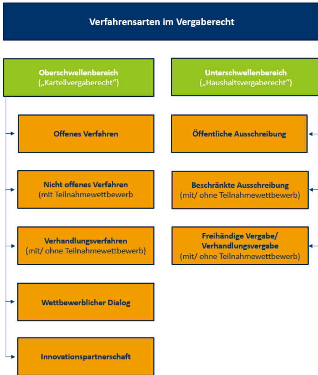
Abbildung 1: Verfahrensarten im Vergaberecht

Im Folgenden werden zum Stand Juni 2024 abgeschlossene und laufende Forschungsprojekte beschrieben (siehe Tabelle 1). Grundsätzlich werden die Forschungsaufträge im Rahmen des Vergaberechts als Leistungsbeschreibung veröffentlicht und vergeben. Das Vergaberecht ermöglicht unterschiedliche Formen der Vergabe (siehe Abbildung 1).