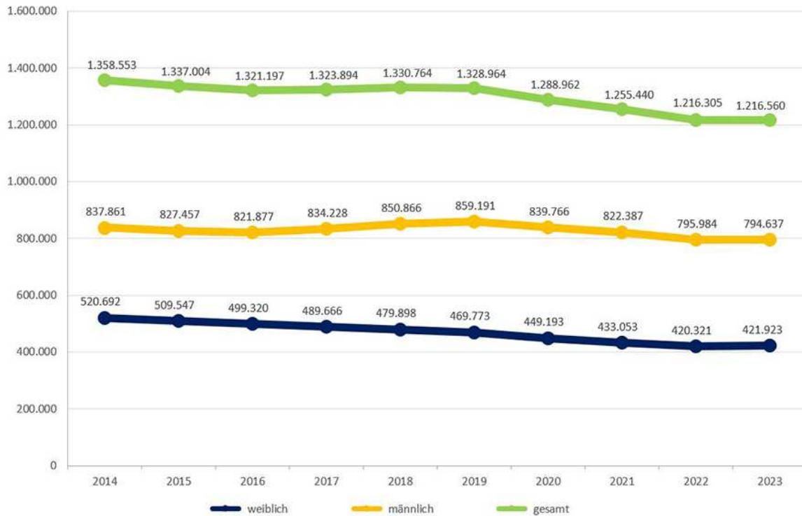
Abbildung 2: Entwicklung der Zahl der Auszubildenden