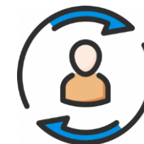
Agente de cambio