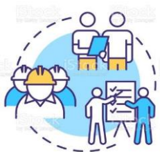
Líder de Procesos