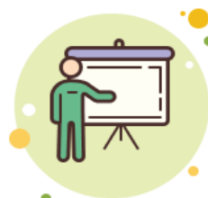
Formador y Líder de Personal