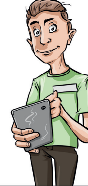
Tim (17) Aushilfe, 1. Lehrjahr Einzelhandelskaufmann Kaufhaus für Bekleidung und Lebensmittel Kaufhaus für Bekleidung und Lebensmittel, sehr sportlich, sehr kreativ, sehr sportlich, auf der Suche nach neuen Erfahrungen