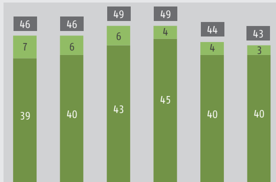
Einmündungsquote der Erstbewerber/-innen (in %)

■ betriebliche Ausbildung ■ außerbetriebliche Ausbildung