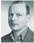
CHRISTIAN IMDORF Prof. Dr., Seminar für Sozio- logie, Universität Basel

In den deutschsprachigen Ländern werden seit Ende der 1990er Jahre Aus- bildungsverbände von den jeweiligen nationalen Berufsbildungsministerien gefördert. 1 Im Ausbildungsmodell, das in der Schweiz staatlich gefördert wird, wechseln die Auszubildenden mehrfach den Ausbildungsbetrieb und erhalten dadurch einen breiteren Einblick in die Tätigkeitsfelder ihres Ausbildungs- berufs. Auf der Basis einer Studie zu Ausbildungsverbänden in der Schweiz gehen wir der Frage nach, welchen Beitrag dieses Modell für eine erweiterte berufliche Handlungskompetenz leistet, aber auch wie Auszubildende und Betriebe die Wechsel der Lernorte bewerten.